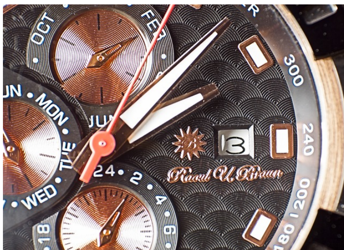
Imagen: Medida del tiempo Licencia: CC0 Public Domain

En esta secuencia trabajaremos con las operaciones con medidas de tiempo.