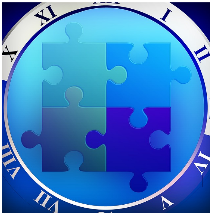
Imagen: Operaciones con medidas de tiempo Licencia: CC0 Public Domain

Obra publicada con Licencia Creative Commons Reconocimiento Compartir igual 4.0